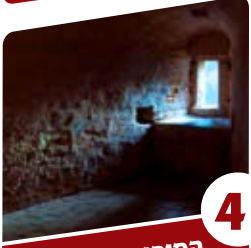
4 הסיפור של ולדר עיר, מקלט