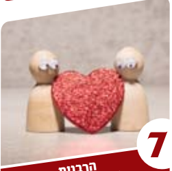
7 הרבנית ימיה מזרחי ככה זה כשיש שניים

יום נאמר: "ויהי ערב ויהי בוקר". מקדימת הערב לבוקר בפסוק, למדו חז"ל שהלילה הולך אחר היום, ויש למנות כל יום החל מצאת הכוכבים עד השקיעה למחרת.